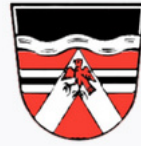
Wappen der Gemeinde Aham